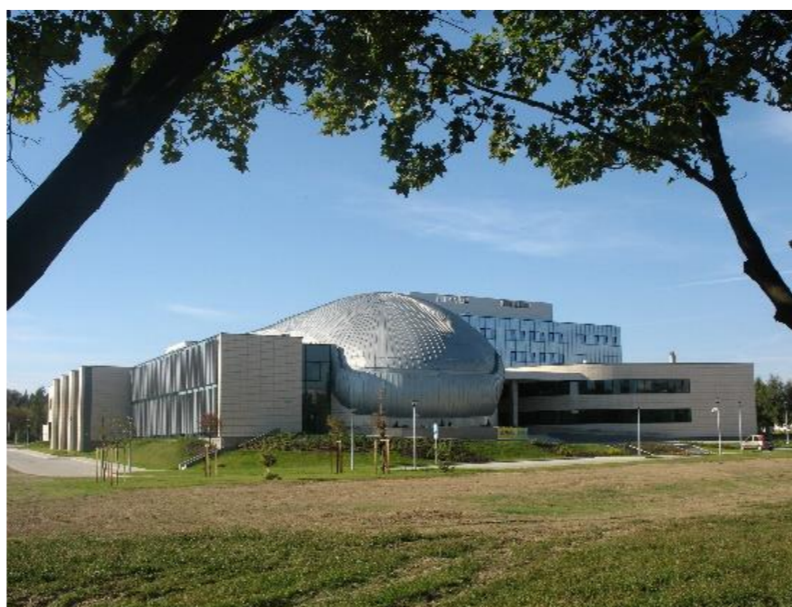
Flagowy budynek V Politechniki Rzeszowskiej